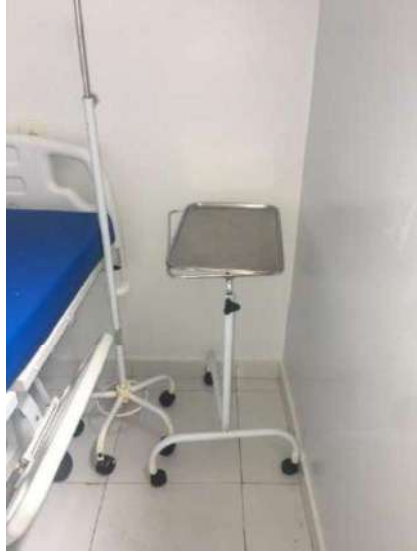
11- TRES BANDEJAS DE METAL