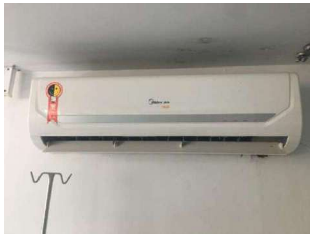
90- UM AR CONDICIONADO MIDEA