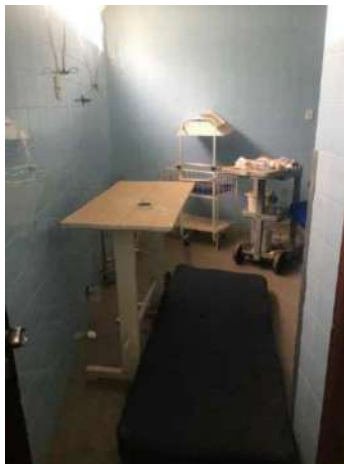
97- UM COLCHÃO AZUL