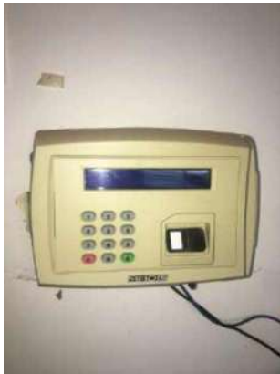
43 – RELOGIO DE PONTO MADIS