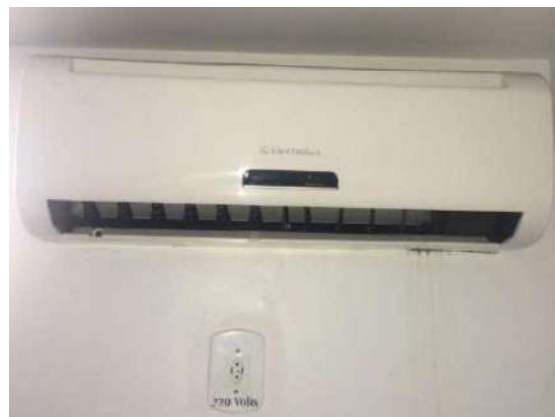
48 – UM AR CONDICIONADO ELECTROLUX