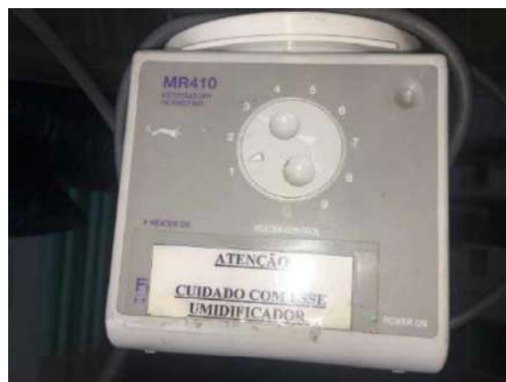
92- UM UMIDIFICADOR UTI