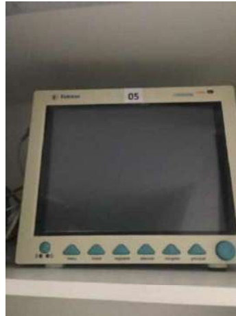
87- OITO MONITORES HOSPITALARES