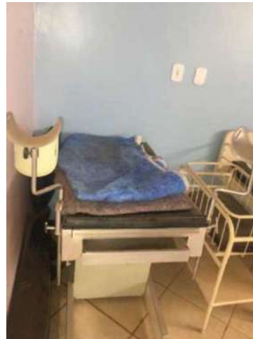
58 – UMA MESA DE EXAME