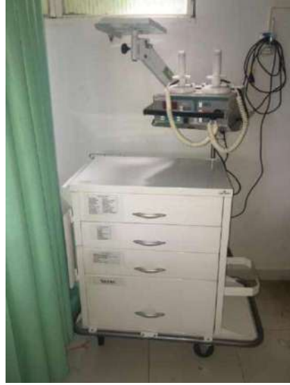
12 - CÔMODA DE MADEIRA BRANCA – CARRO CIRURGICO