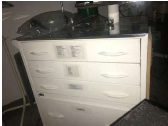
45 – SUPORTE CIRURGIA BRANCO