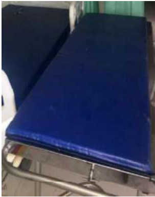
81- UMA MACA