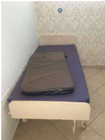
101- UMA MACA