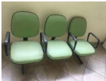
65 – CINCO CONJ CADEIRAS VERDES DE 3 ASSENTOS