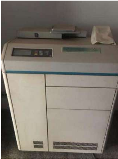
3 -EQUIPAMENTO DE IMAGEM IMATION 969 HQ LASER IMAGER