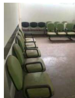
67- CONJ CADEIRAS VERDES DE 05 ASSENTOS