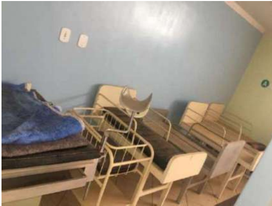
57 – CINCO MACAS DE BEBÊ