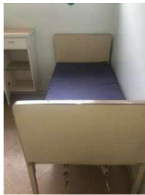
82- UMA CAMA