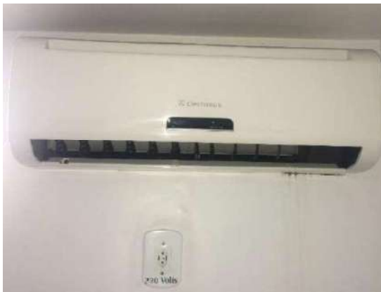
107- AR CONDICIONADO ELETROLUX