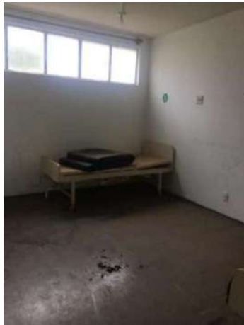
36 – UMA MACA