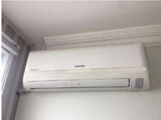
51 – UM AR CONDICIONADO SAMSUNG VIRUS DOCTOR