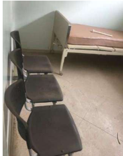
42 – CONJUNTO DE TRÊS CADEIRAS