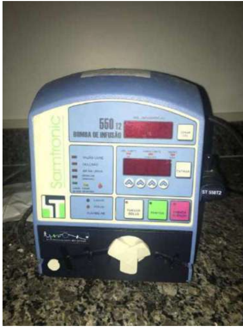
23 - BOMBA DE FUSÃO