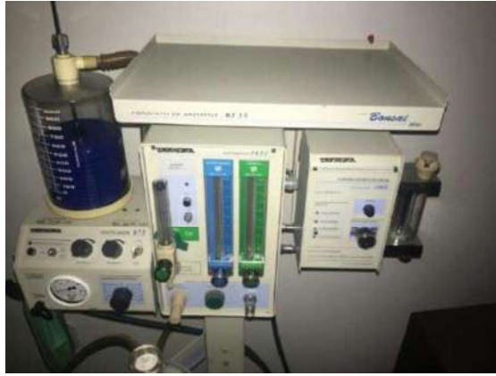
15 - CONJ ANESTESIA BONSAI PLUS – TAKAOKA KT 15