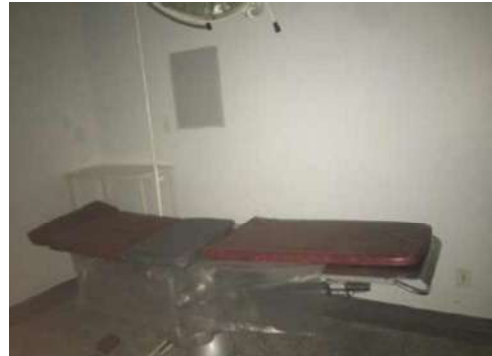
14 - MESA CIRÚRGICA DE APOIO