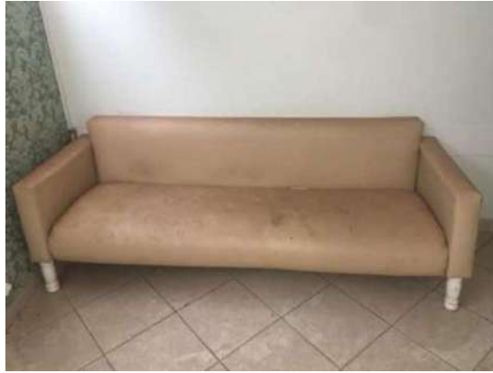
50 – UM SOFÁ AMARELO