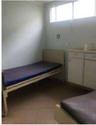
49 – UMA MACA