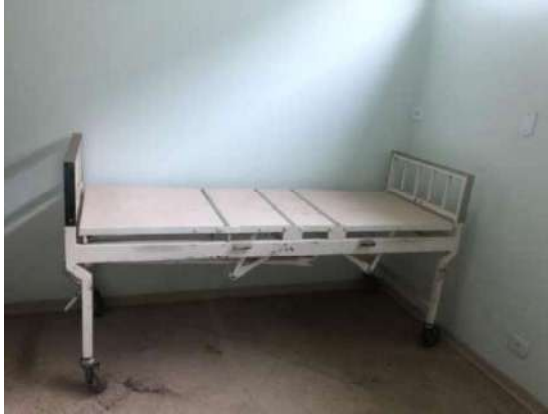
29 - QUATRO CAMAS