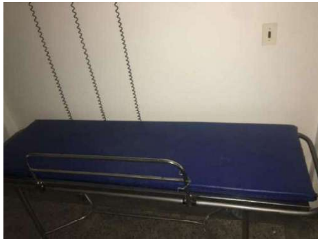
6 - MACA

Valor: R$ 10.000,00 PROCESSO CIVIL E DO TRABALHO -> Processo de Conhecimento -> Procedimento de Conhecimento -> Procedimentos Especiais -> Procedimentos Regidos por Outros Códigos, Leis Esparças e Regimentos INHUMAS - 2ª VARA CIVIL Usuário: DANIEL MOREIRA LOPES - Data: 07/11/2023 09:51:43