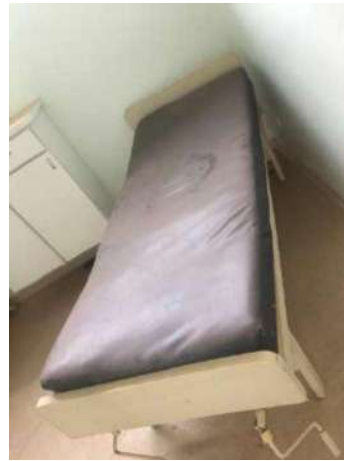
64 – DUAS MACAS