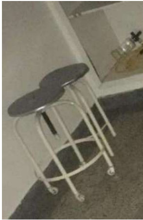
9 – DOIS BANCOS DE METAL