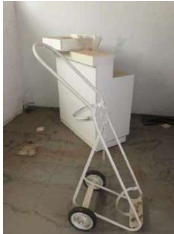
79- UM CARRINHO DE TRANSP DE BALA DE OXIGÊNIO BRANCO