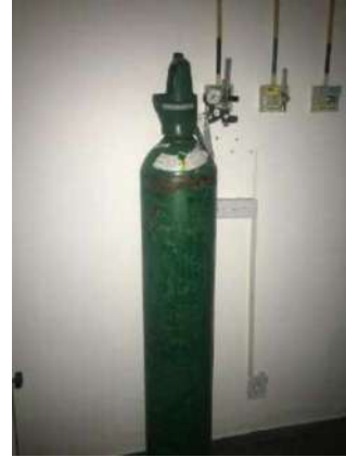
16 - BALÃO DE OXIGENIO