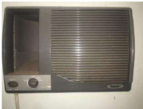
37 – UM AR CONDICIONADO