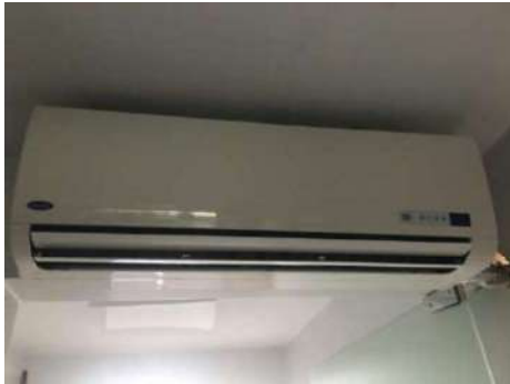
95- UM AR CONDICIONADO SPRINGER