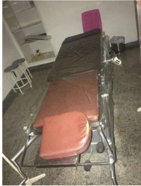
24 - MESA CIRURGICA