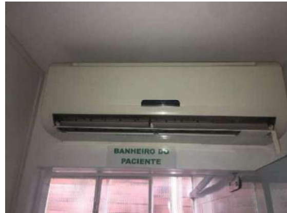
108- AR CONDICIONADO SEM MARCA APARENTE