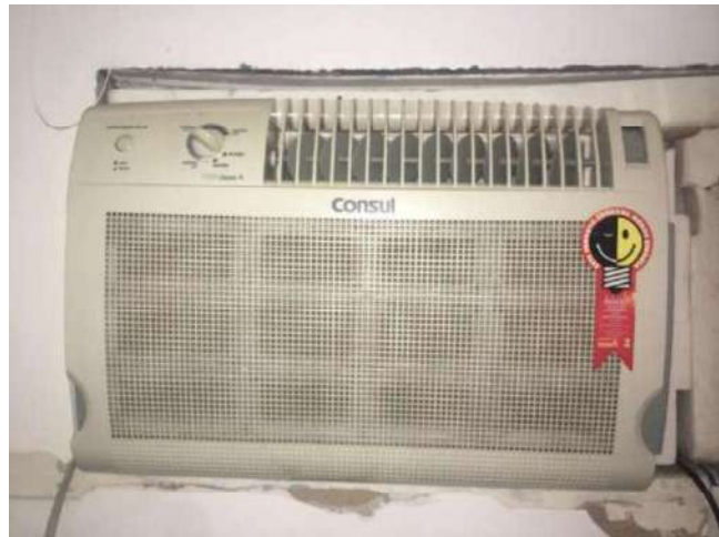
100- UM AR CONDICIONADO CONSUL