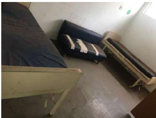
20- DUAS CAMAS HOSPITALARES