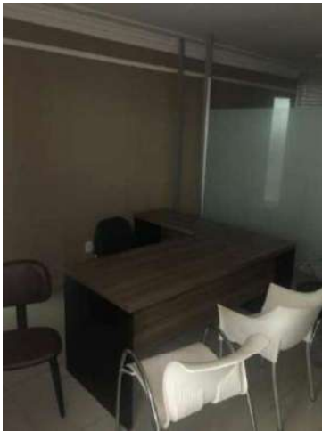
99- UMA MESA EM "L" MARROM