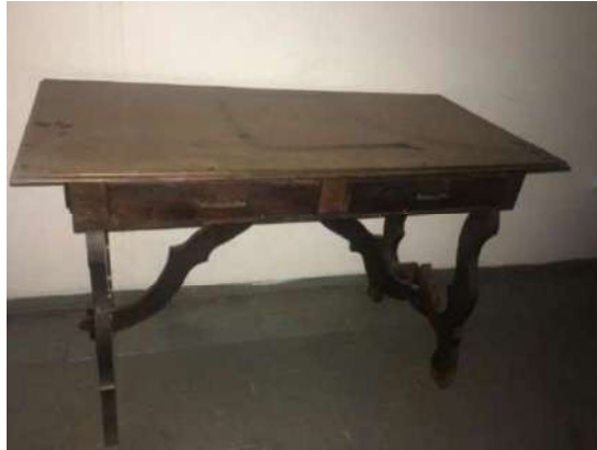
44 – UMA MESA DE MADEIRA