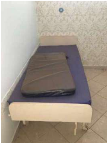
55 – TRÊS MACAS