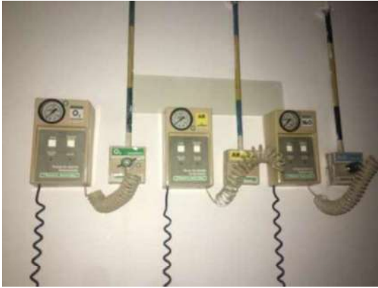
7-EQUIP. OXIGÊNIO AR COMPRIMIDO Nº 20