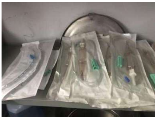
103- SETE ESCALP PARA SORO