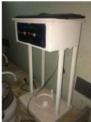
84- UM DRENO TERMOSTATICO