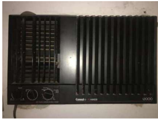
72- AR CONDICIONADO PRETO CONSUL MASTER 12000