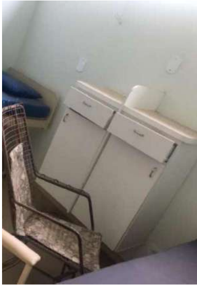
17 - ARMARINHO BRANCO