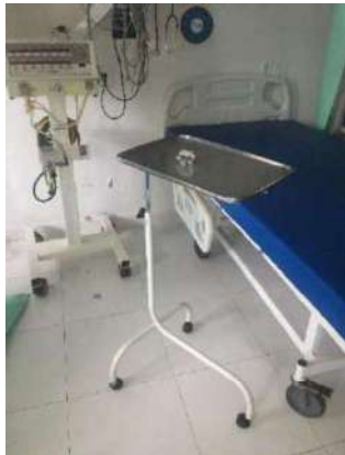
116 a 121- SUPORTES CIRÚRGICOS E BANDEIJAS CIRÚRGICAS