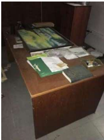
75 – UMA MESA DE MADEIRA