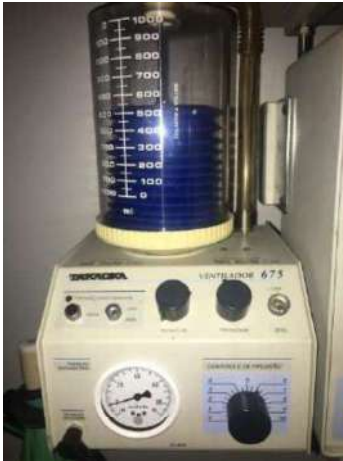
86 -EQUIPAMENTOS DE AR