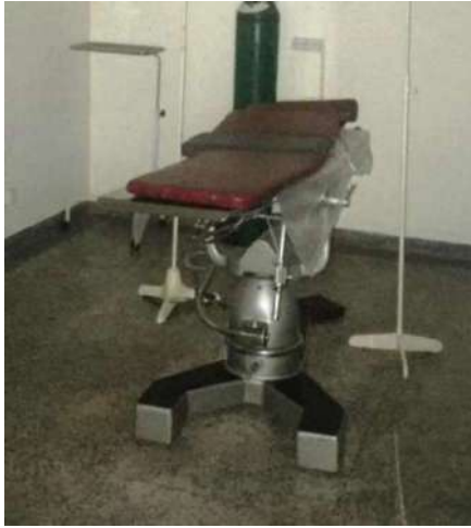
27 – DUAS MESAS CIRURGICAS