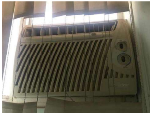
98- UM AR CONDICIONADO SPRINGER