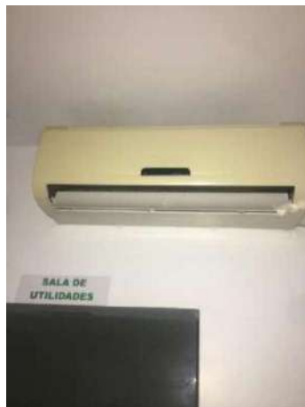
91 - UM AR CONDICIONADO S/ MARCA AP.