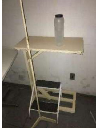
114 E 115- SUPORTES CIRÚRGICOS E BANDEJA CIRÚRGICA