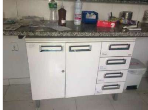
34 – UM ARMÁRIO BRANCO