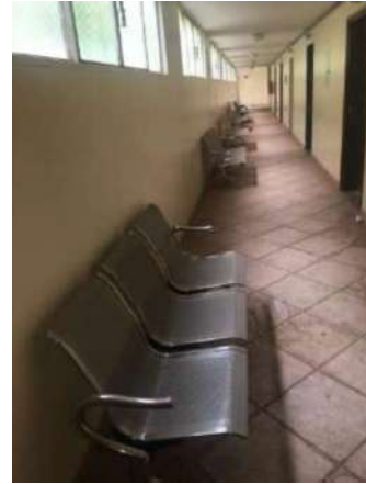
94- QUATRO CONJ DE CADEIRAS TRÊS LUGARES DE METAL