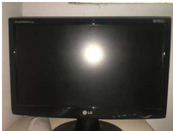
102- UM MONITOR LG