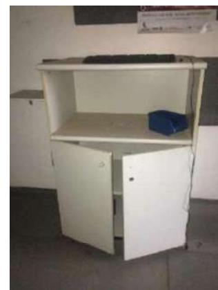
110, 111, 112- ARMÁRIOS DE MADEIRA BRANCOS