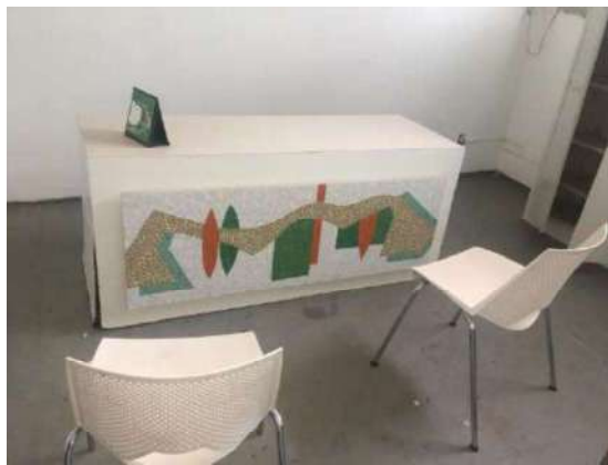
35 – DUAS CADEIRAS BRANCAS