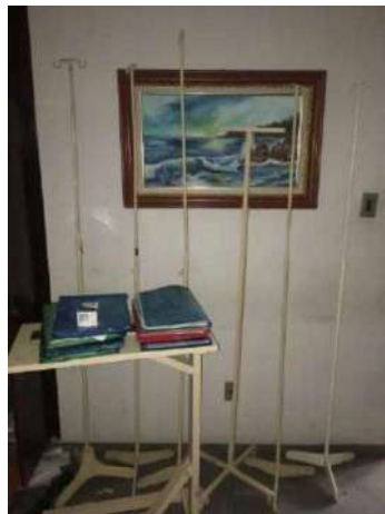
73- QUATORZE SUPORTE DE SORO