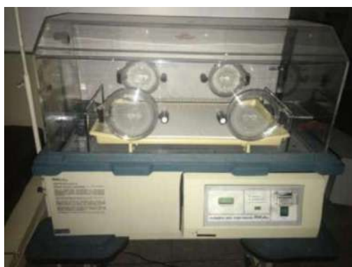
21 - INCUBADORA RECEM NASCIDO