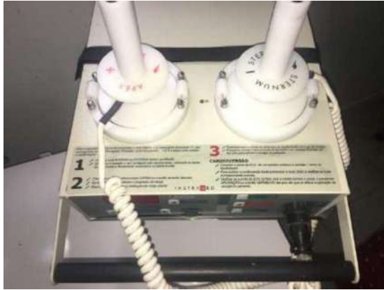
93- UM DESFRIBILADOR