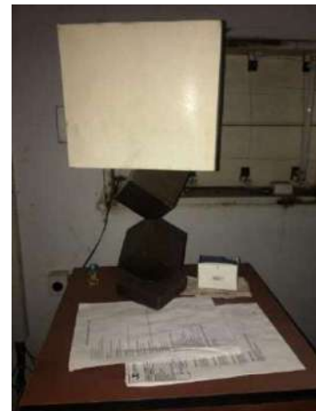
77- UM ABAJUR