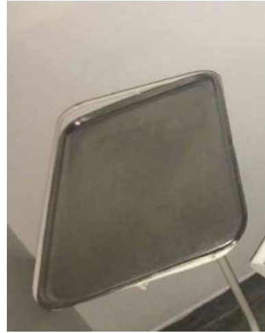
28 – BANDEJA DE METAL