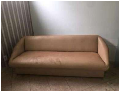
53 – UM SOFA AMARELO