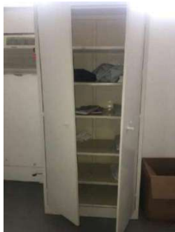
59 – UM ARMÁRIO DE METAL