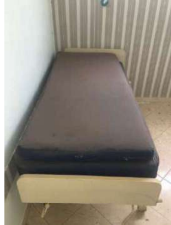
62 – DUAS MACAS