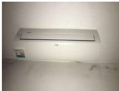
22 - AR CONDICIONADO LG