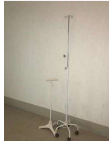
88- QUINZE EQUIP DE PENDURAR SORO