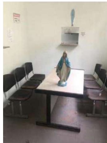
74- DOIS CONJ CADEIRAS PRETAS DE 3 ASSENTOS