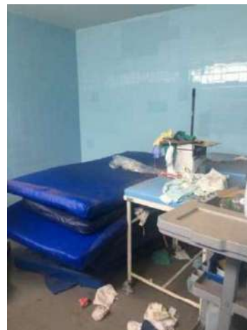
60 – NOVE COLCHÕES AZUIS