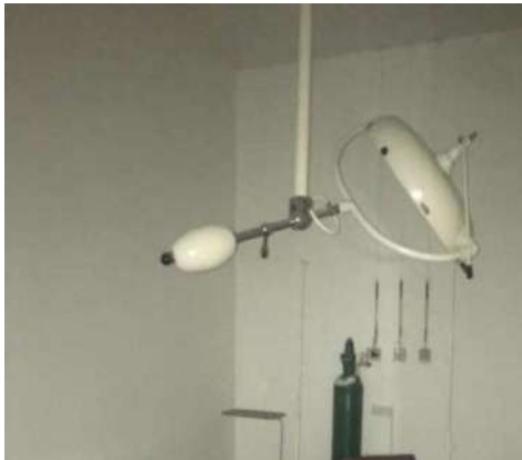
25 - FOCO CIRURGICO BAUMER