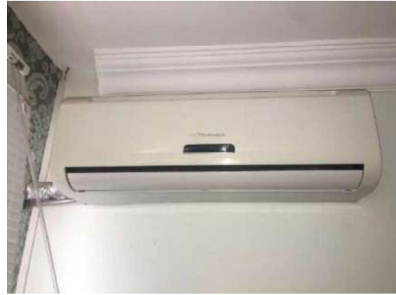
8 - AR CONDICIONADO ELECTROLUX