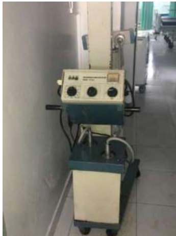
89- UM EQUIPAMENTO DE RAIOS X