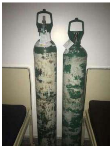
19 - DOIS BALÕES DE OXIGÊNIO