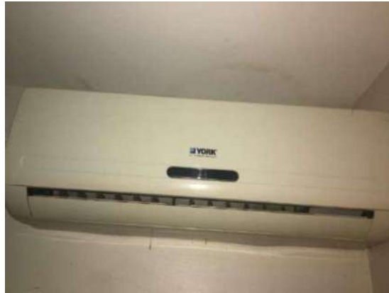
56 – UM AR CONDICIONADO YORK