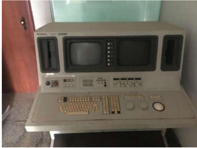
1 -EQUIPAMENTO DE TOMOGRAFIA – EXCEL 820 ELSCLNT