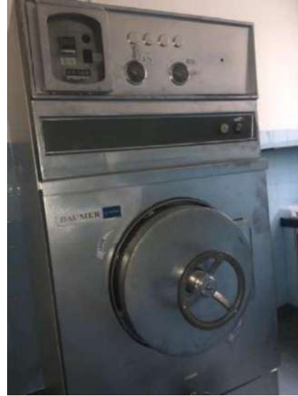
18 - AUTOCLAVE BAUMER HI-SPEED