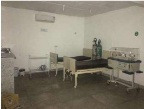
33 – DUAS CAMAS