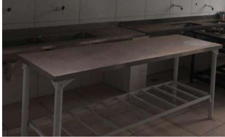
10 - MESA DE METAL