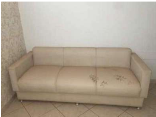
47 –UM SOFA AMARELO