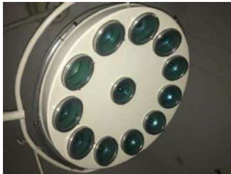
13 - FOCO CIRÚRGICO