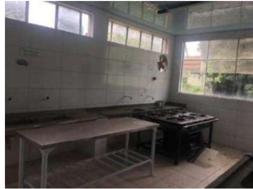
106- UM FOGÃO INDUSTRIAL SEIS BOCAS ANTIGO