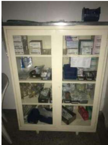
5 - ARMARIO DE VIDRO