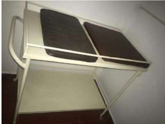
61 – UMA MACA BEBÊ