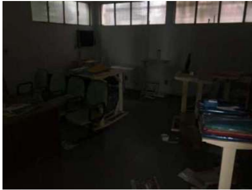
105- DOIS JOGOS DE CADEIRA DE ASSENTO