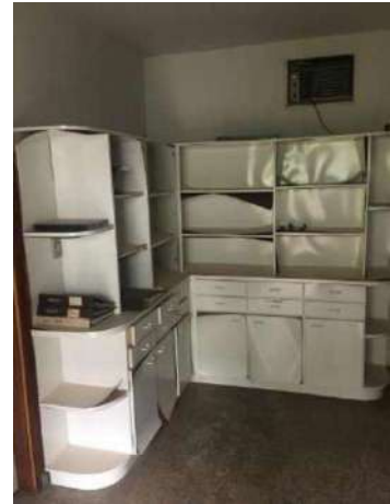
80- DOIS ARMARIOS BRANCOS