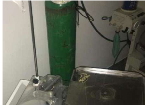
26 - BALÃO DE OXIGÊNIO