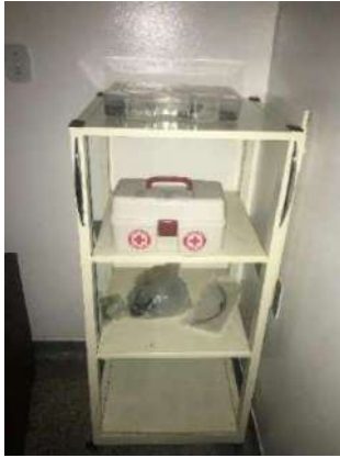
113- PRATELEIRA AÇO