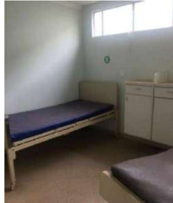
52 – UMA MACA