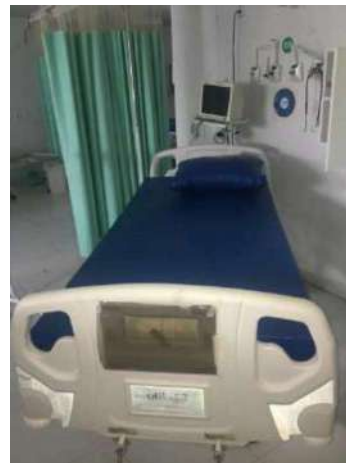
85- DOZE MACAS UTI