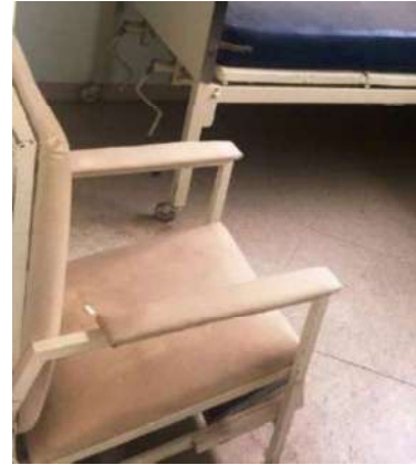
30 – UMA CADEIRA