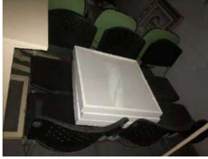
122- CONJUNTOS DE 3 CADEIRAS