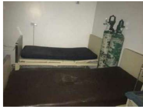
83- DUAS CAMAS