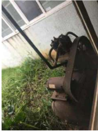
68- UM COMPRESSOR DE AR