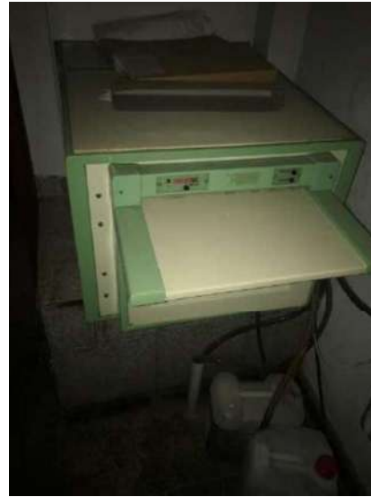
4- REVELADORA MACROTEC MX2