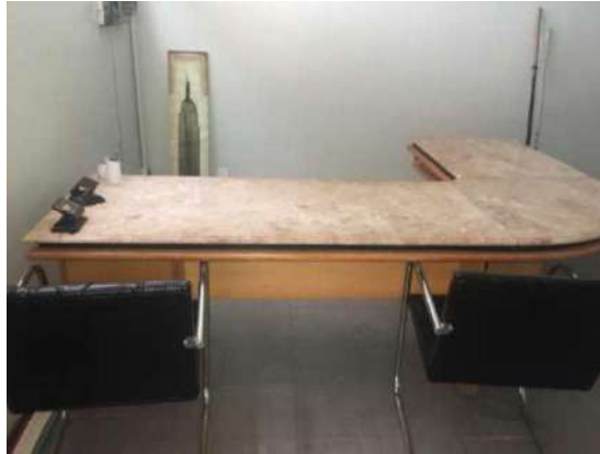
40 – UMA MESA DIAGONAL