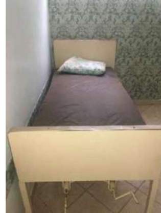
46 – UMA MACA