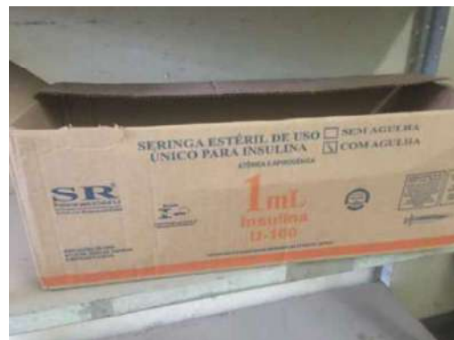
104 - UMA CAIXA DE SERINGAS