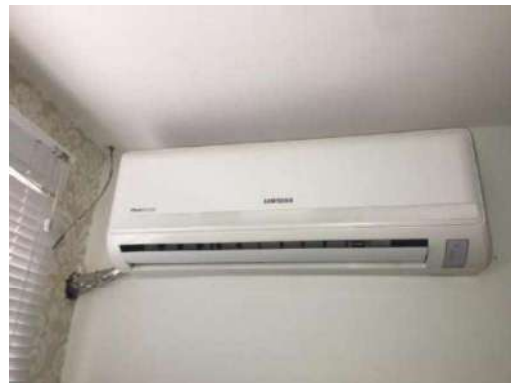
54 – AR CONDICIONADO VIRUS DOCTOR SAMSUNG