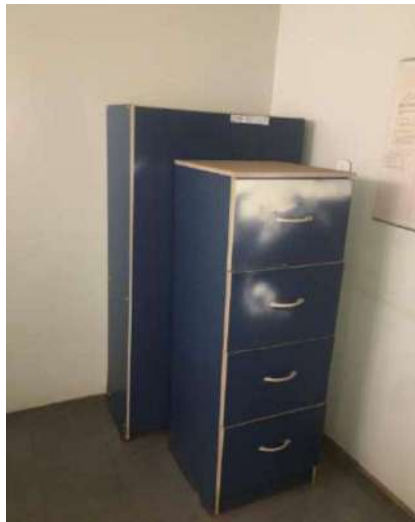
41 – DOIS ARMARIOS AZUIS