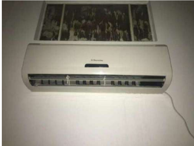
2 - AR CONDICIONADO ELECTROLUX