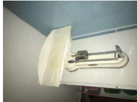
96- UMA BALANÇA ANTIGA