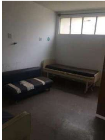
63 – UM SOFÁ AZUL RASGADO