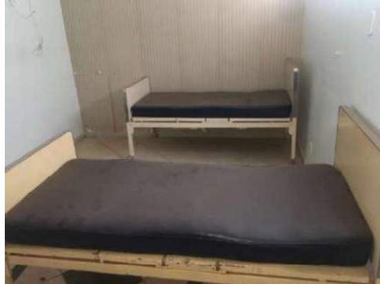
32 – DUAS CAMAS