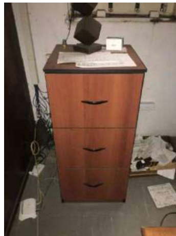
76- UMA COMODA DE MADEIRA