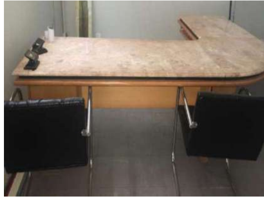
39 – DUAS CADEIRAS