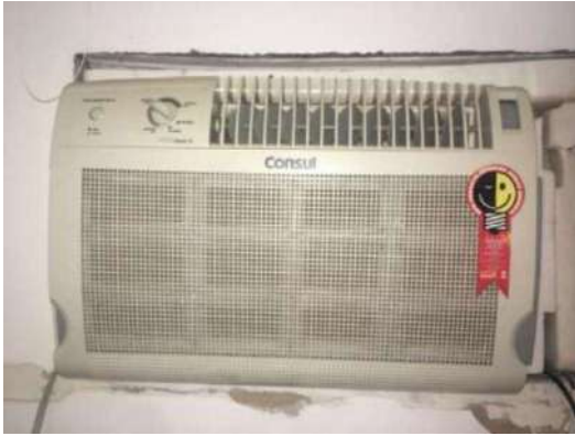
38 – UM AR CONDICIONADO