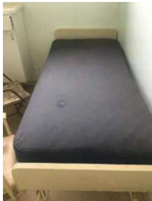
31 – UMA CAMA