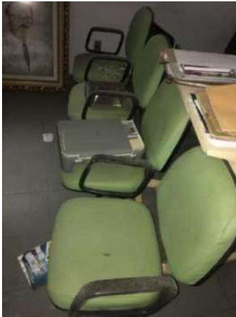
78- UM CONJ Cadeira VERDE QUATRO ASSENTOS